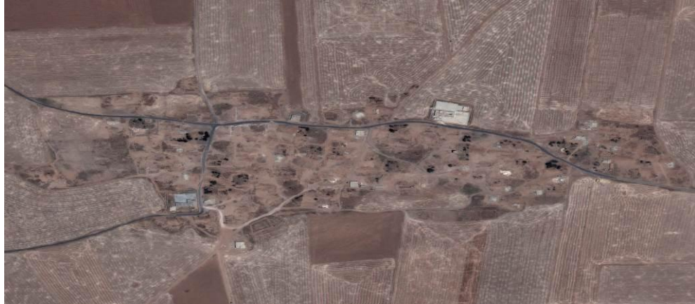
Hüseyniye köyüne ait 2015 yılı Haziran ayında çekilen uydu görüntüsü neredeyse tüm köyün yerle bir olduğunu göstermektedir.

Bölge sakinleri köyün 2013 yılı Şubat ayında silahlı muhalif grup olan Özgür Suriye Ordusu'nun (ÖSO) kontrolüne geçtiğini söyledi. Tel Hamis kırsalından yerel bir Arap yetkili YPG'nin ÖSO ve diğer devlet dışı silahlı gruplarla ilk kez 2013 yılı Aralık ayında Tel Hamis kırsalında çatışmaya girdiğini ve ÖSO ve YPG arasındaki en büyük karşılaşmanın 2014 yılı Şubat ayında Hüseyniye köyünde gerçekleştiğini söyledi. 3 Yetkili, o sırada Ahrar al-Sham, Liwa' 114, Forsan al-Sunna ve İD ile bağlantılı bir