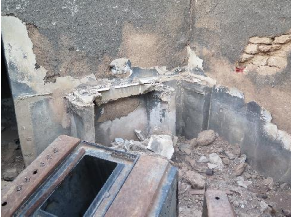
Bassma Mohamed al-Bilal'in eşinin ailesinin Tel Diyab'daki evinin yangın sebebiyle tahrip olmuş bir odası.