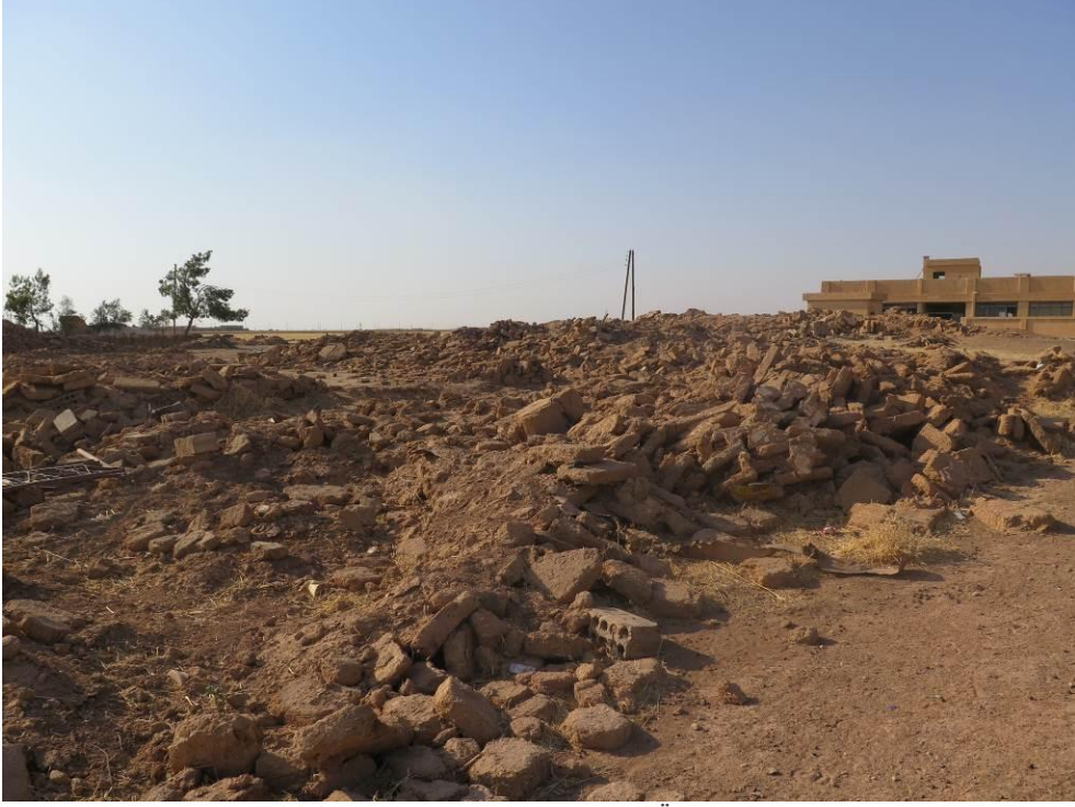
Hüseyniye köyünde yıkılan evlerden bazıları.

Uluslararası Af Örgütü 2015 yılı Ağustos ayı başında Tel Hamis kırsalında bir Arap köyü olan Hüseyniye'yi ziyaret etti. Köylüler Uluslararası Af Örgütü araştırmacılarına köyde yaklaşık 90 evin yıkıldığını, geriye sadece tek bir evin kaldığını söyledi ve Uluslararası Af Örgütü araştırmacıları ziyaret sırasında yıkılan evlerin kalıntılarını gördü. Hüseyniye köyünün 2014 Haziran ve 2015 Haziran aylarında çekilen ve Uluslararası Af Örgütü tarafından incelenen uydu görüntüleri 2014 yılında 225 binanın ayakta durduğunu ancak 2015 yılında geriye sadece 14 binanın kaldığını, yani bir yıl içerisinde %93,8 oranında bir yıkımın gerçekleştiğini yansıtmaktadır. Uydu görüntüsüne yansıyan yıkım, bombardımanla değil köyün yıkılmasıyla bağlantılıdır. Bölge sakinleri, YPG'nin 2015 yılı Şubat ayında sakinlerin çoğunu yakın köylere ve Kamışlı şehrine doğru yerinden ederek yıkımları gerçekleştirdiğini söyledi. Bazı Hüseyniye sakinleri yıkılmamış bir okulda yaşayarak köyde kalmaya devam etti.