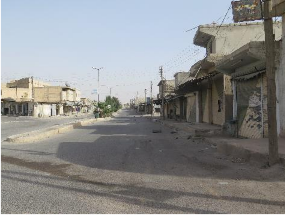
Bölge sakinlerinin geri dönmesine izin verilmeyen Suluk kasabası, 30 Temmuz 2015.