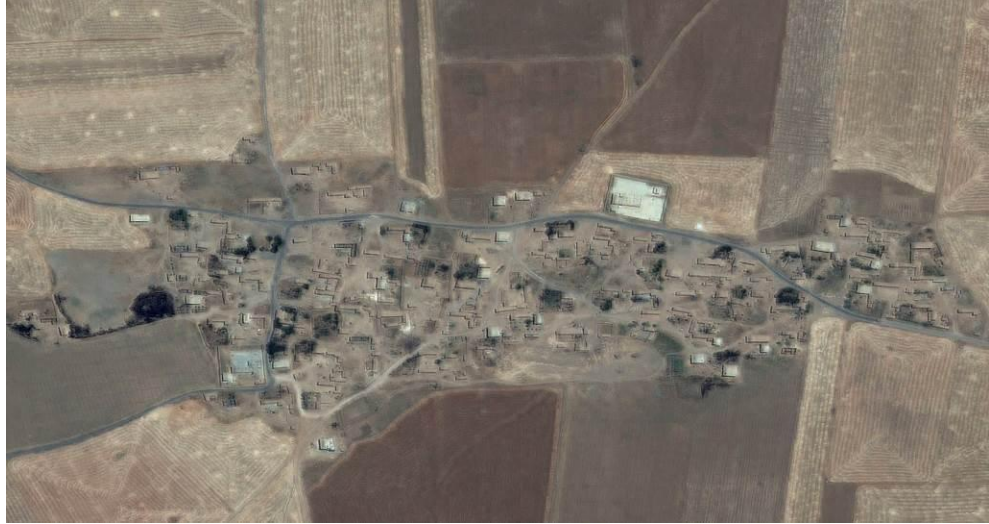
Hüseyniye köyüne ait 2014 yılı Haziran ayında çekilen uydu görüntüsü ©CNES 2015, Distribution AIRBUS DS, Haziran 2014.