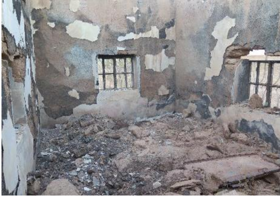
Bassma Mohamed al-Bilal'in Tel Diyab'daki evinin yangın yüzünden tahrip olmuş odası.

Bassma Uluslararası Af Örgütü'ne, öğretmen olan eşinin 2011 yılında barışçıl gösterilerde bulunması sebebiyle Suriye hükümeti tarafından gözaltına alındığını ve 2011 yılı sonunda serbest bırakıldıktan sonra Suriye'yi terk ettiğini söyledi. 65 Bassma, eşinin hiçbir zaman ÖSO'ya katılmadığını ya da silahlanmadığını belirtti. 2015 yılı Ağustos ayında Uluslararası Af Örgütü ile konuştuğunda eşi Avrupa'da sığınmacıydı ve eşine katılmak üzere yerleştirme başvurusu beklemeydi.