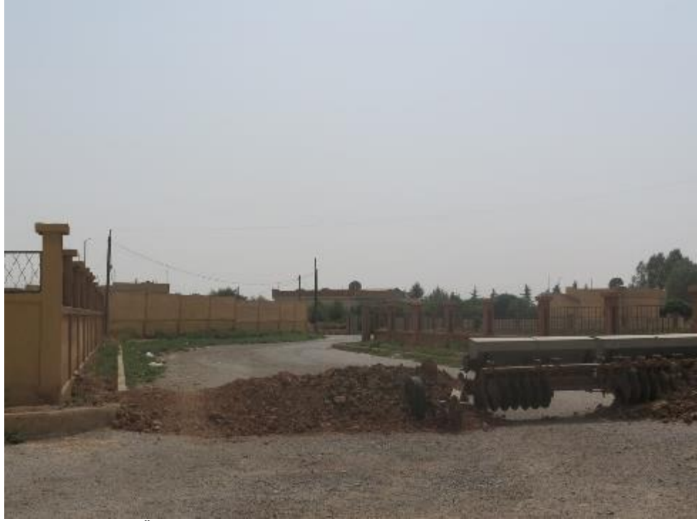
Hamam Türkmen'in Özerk Yönetim tarafından yerleştirilen bir bariyerle kapatılan girişi, 30 Temmuz 2015.

Gündelik işçi olarak çalışan ve köylüler yerinden edildiklerinde orada bulunan bir bölge sakini olan Farid 27 Uluslararası Af Örgütü'ne, köyde 10 Kürt ailesiyle birlikte yaklaşık 1,400 Türkmen ailenin yaşadığını anlattı. 28 35 yaşında ağır işçi olan bir diğer bölge sakini Wael 29 köyde yaklaşık 1,000 evin olduğunu söyledi. Farid, 2012'de ÖSO'nun köyün kontrolünü ele geçirdiğini, 2013'te onlara Cephel el-Nusra'nın katıldığını ve 2014'te İD'in kontrolü ele geçirdiğini anlattı. Farid, İD köyün yönetimini ele geçirdikten sonra bazı çocukların İD'e katıldığını ancak bu bölge sakinlerinin köylerini YPG'ye kaptırınca İD ile birlikte ayrıldıklarını söyledi. 30 YPG köyü aldıktan sonra 15 Haziran'da Kamışlı'daki bir kontrol noktasında Hamam Türkmen'e 4 km uzaklıkta bomba yüklü bir araç uç YPG savaşçısını öldürdü. Bir sonraki gün, İD geri püskürtülmeden önce köyde YPG ve İD arasında çatışmalar yaşandı. 18 Haziran'da köydeki bir sağlık ocağında bulunan YPG kontrol noktasında ikinci bir bomba yüklü