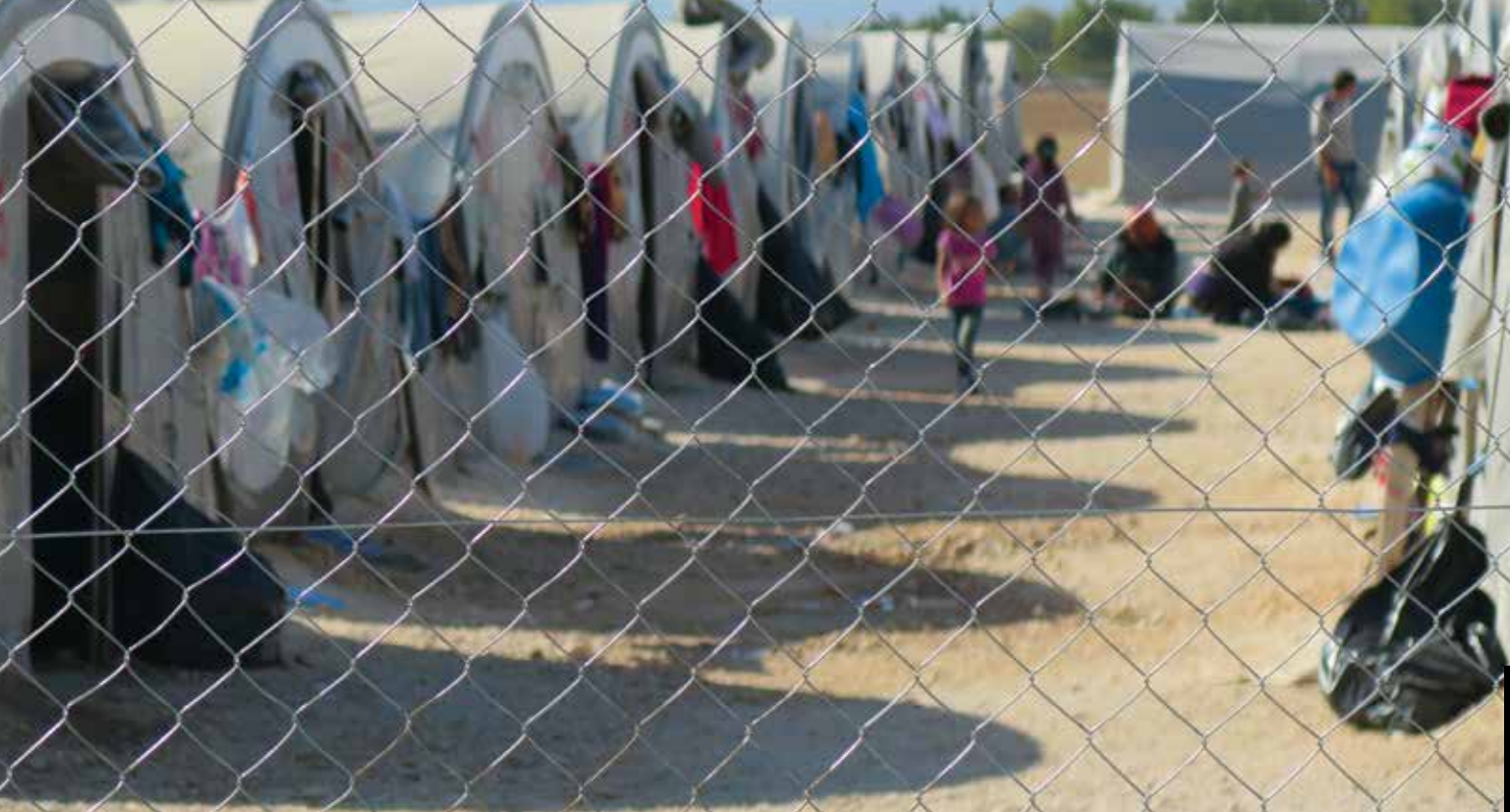
Türkiye / Suruç