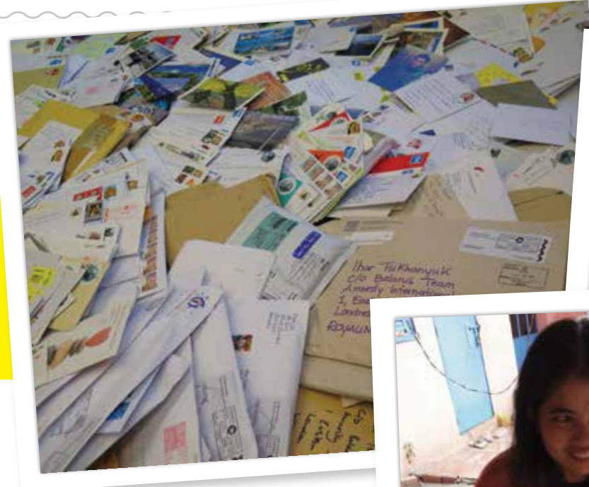
Aralık 2013; Ihar Tsikhanyuk'a gönderilen bazı mektuplar.

Doğu Badia'da yaşayanlar yetkililer tarafından evlerinden zorla çıkarıldıktan sonra sizler gibi 83.000'den fazla kişi harekete geçti.