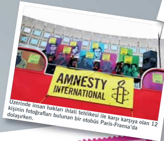
Uzerinde insan hakları ihlali tehlikesi ile karşı karşıya olan 12 kişinin fotoğrafları bulunan bir otobüs Paris-Fransa'da dolaşırken.