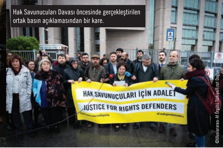
Hak Savunucuları Davası öncesinde gerçekleştirilen ortak basın açıklamasından bir kare.