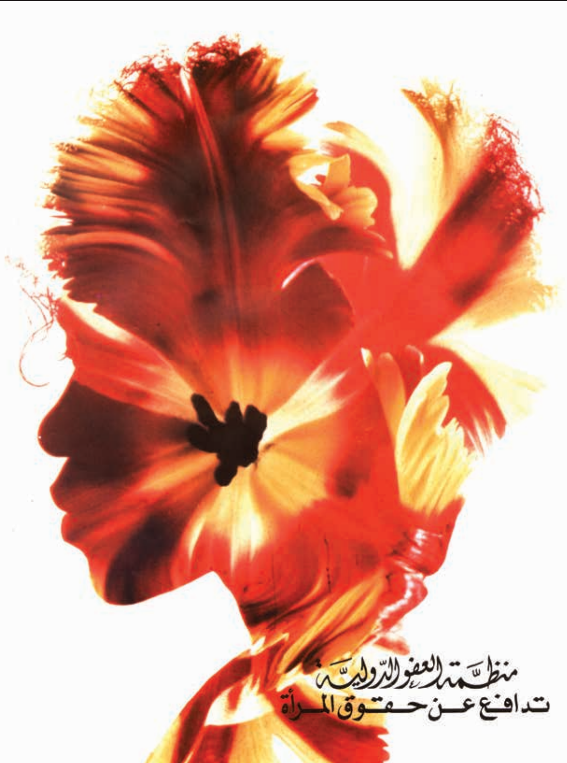
Uluslararası Af Örgütü Mısır Şubesi tarafından kadın insan hakları savunucularına dikkat çekmek amacıyla hazırlanmış poster, 1993 ©Amnesty International