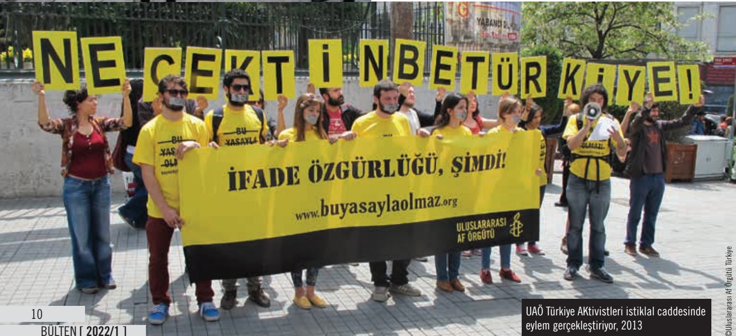
UAÖ Türkiye Aktivistleri istiklal caddesinde eylem gerçekleştiriyor, 2013

5- Türkiye'de insan hakları mücadelesini büyütme isteyen destekçilerimize bir sonraki 20 yıl için mesajınız nedir? İnsan hakları mücadelesi uzun soluklu, coğrafya, ülke farkı tanımayan evrensel ve bölünmez bir mücadele. Umudu hiçbir zaman kaybetmemek, dayanışmadan güç almak ve adaletin bir gün mutlaka sağlanabileceğine dair inancımızı canlı tutmak sanıyorum en önemli nokta olacaktır, bugüne kadar olduğu gibi. Bizler gücümüzü, haklı olmaktan, adaletten, evrensel normlardan ve eşitlikten alıyoruz. O yüzden mücadelemizin temelleri çok sağlam. Bu sağlam temeller üzerinde, dayanışma içerisinde, tüm dünyada ve Türkiye'de mücadelemize devam edeceğiz. Büyüyoruz, dayanışma içinde ve bir arada. Çünkü adalet ve herkes için insan hakları bir gün mutlaka tüm dünyada tesis edilecek.