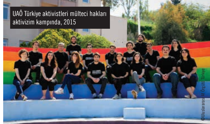
UAÖ Türkiye aktivistleri mülteciler için hakları aktivizmi kampında, 2015

evrensel dayanışma duygusu ile yerelde çalışan hak örgütleriyle de hak savunucularıyla da yakın bağlar ve işbirliği içerisinde olmayı elbette hep önemsedik. 20 yıldır, aslında uluslararası insan hakları hareketinden aldığımız gücü, yerelle paylaşmayı ve dayanışmayı, esas olarak hak savunuculuğu faaliyetlerimizi yürütmeyi temel aldık. Hem kampanyalarımızda hem her türlü iletişim faaliyetimizde, hem insan hakları eğitimi çalışmalarımızda hem de lobi çalışmalarımızda, yereldeki hak örgütleriyle yakın şekilde çalıştık, dayanışmamızı artırmanın yollarını aradık ve böyle hareket ettik. Hak hareketinin başarısının da buradan geçtiğini düşünüyoruz.