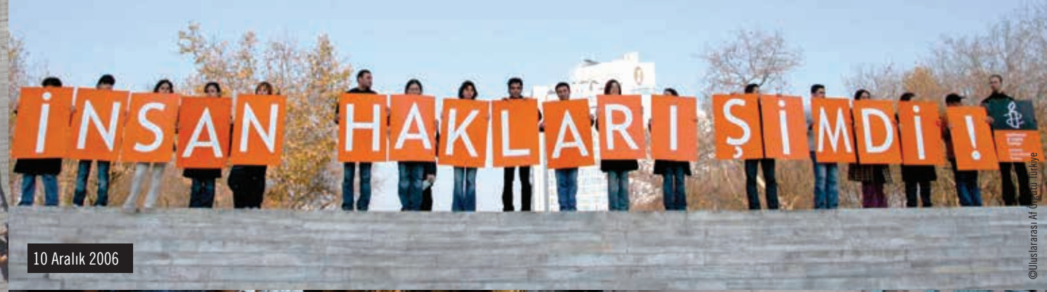
10 Aralık 2006