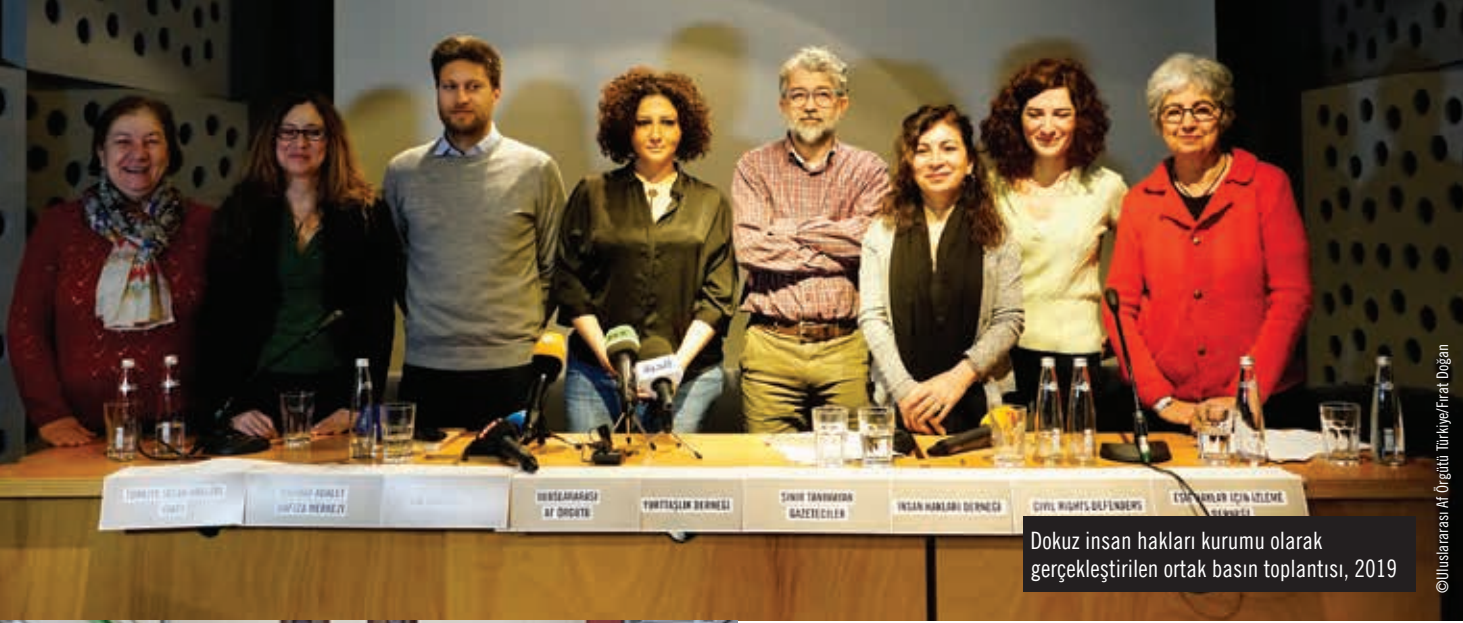
Dokuz insan hakları kurumu olarak gerçekleştirilen ortak basın toplantısı, 2019