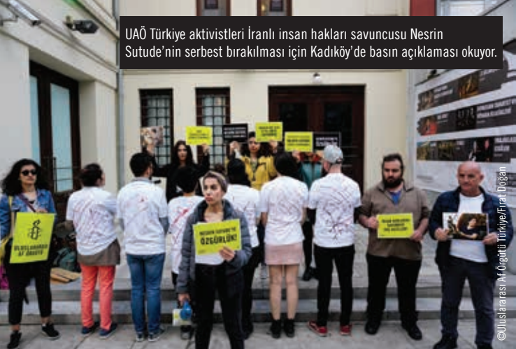
UAÖ Türkiye aktivistleri İranlı insan hakları savucusu Nesrin Sutude'nin serbest bırakılması için Kadıköy'de basın açıklaması yapıyor.