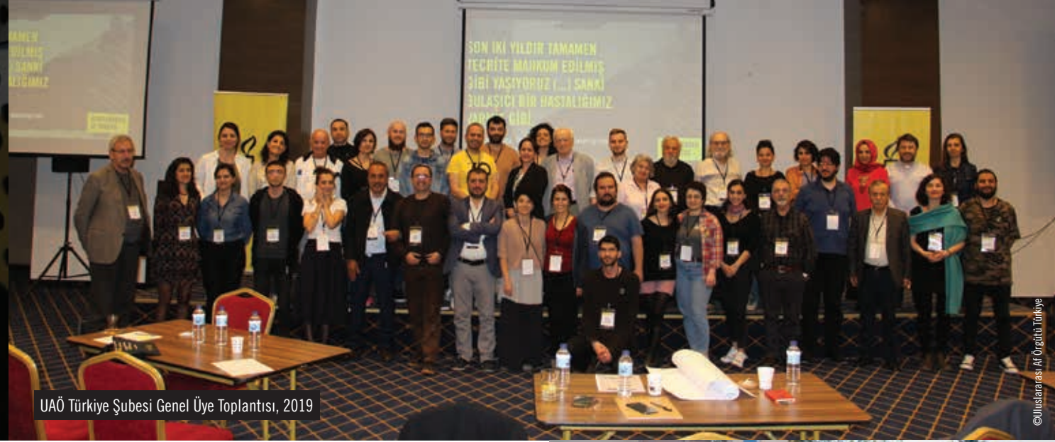
UAÖ Türkiye Şubesi Genel Üye Toplantısı, 2019