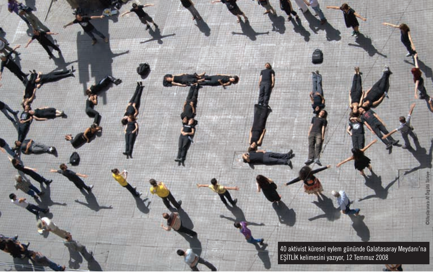
40 aktivist küresel eylem gününde Galatasaray Meydanı'na EŞİTLİK kelimesini yazıyor, 12 Temmuz 2008