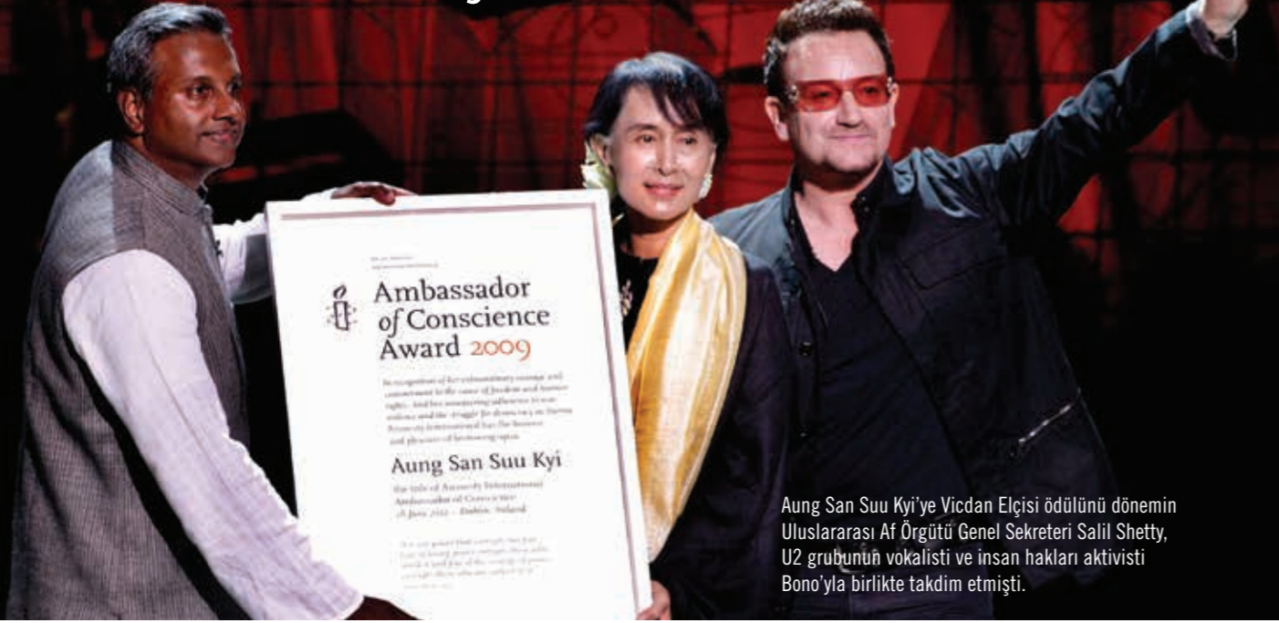
Aung San Suu Kyi'ye Vicdan Elçisi ödülünü dönemin Uluslararası Af Örgütü Genel Sekreteri Salil Shetty, U2 grubunun vokalisti ve insan hakları aktivisti Bono'yla birlikte takdim etmişti.

Uluslararası Af Örgütü olarak, 2009'da Aung San Suu Kyi'ye verilen yüksek onur ödülü, Suu Kyi'nin Myanmar'daki katliamlara kayıtsızlığı nedeniyle geri çektik.