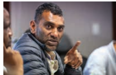
Kumi Naidoo Uluslararası Af Örgütü Genel Sekreteri

Geçen haftalarda Kaşıkçı'nın başına gelenlere dair tüyler ürpertici detayların basında yer almasıyla birlikte, Suudi hükümetinin en yakın müttefiki olarak görülen Amerika Birleşik Devletleri Başkanı Donald Trump, ilk önce "serseri katillerin" sorumlu olabileceği yorumunu yaptı. Suudi yetkililer tarafından yapılan açıklamaların da bu fikri tekrarladığı görülüyor. Buna göre eylem, planlı şekilde hareket eden kişiler tarafından gerçekleştirilmedi, Suudi istihbaratı aniden "serserileşip" Kaşıkçı'yı "yumruk kavgası" sırasında öldürdü.