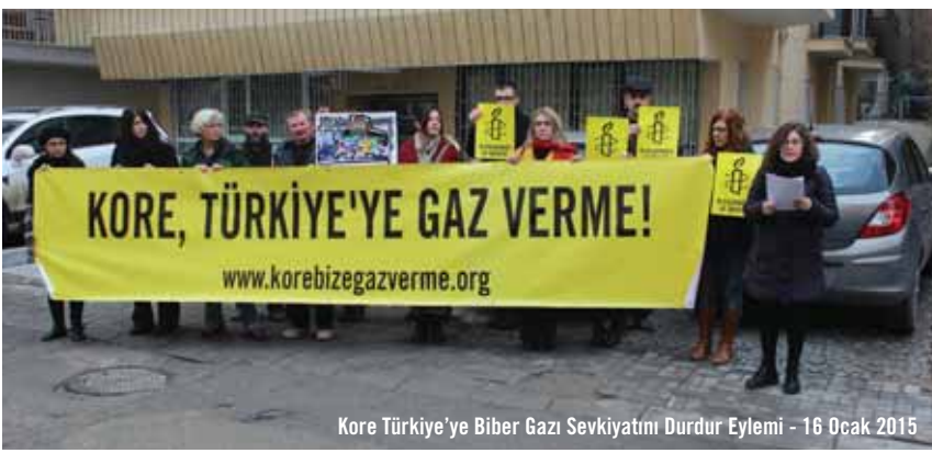
Kore Türkiye'ye Biber Gazı Sevkiyatını Durdur Eylemi - 16 Ocak 2015