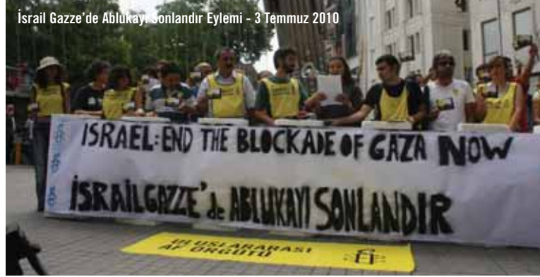
İsrail Gazze'de Ablukayı Sonlandır Eylemi - 3 Temmuz 2010