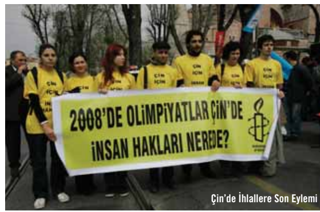
Çin'de İhlallere Son Eylemi