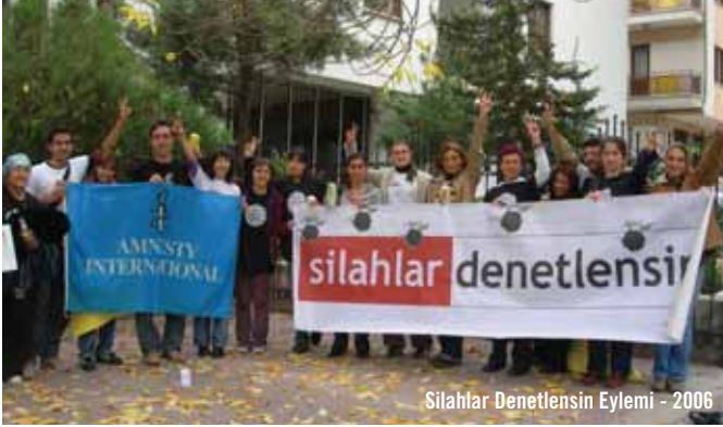
Silahlar Denetlensin Eylemi - 2006