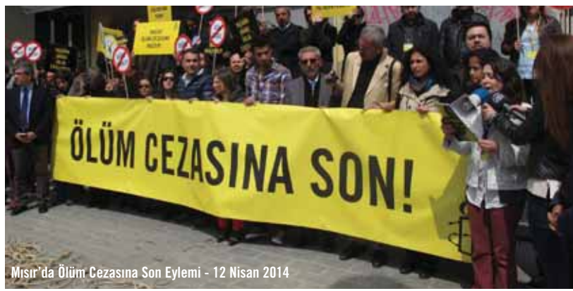
Mısır'da Ölüm Cezasına Son Eylemi - 12 Nisan 2014