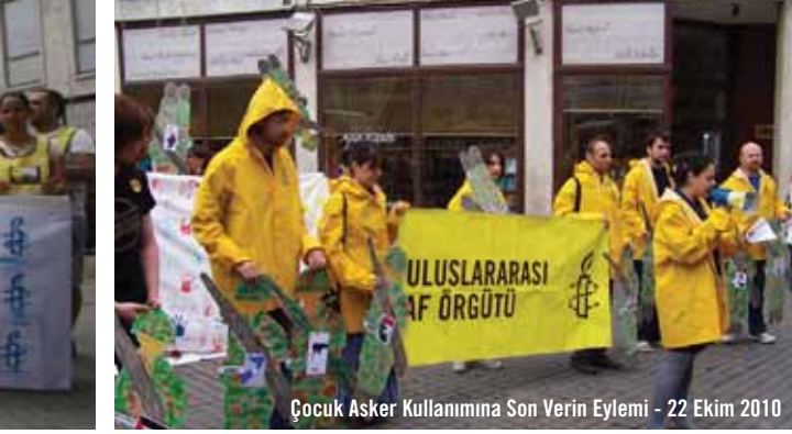
Çocuk Asker Kullanımına Son Verin Eylemi - 22 Ekim 2010