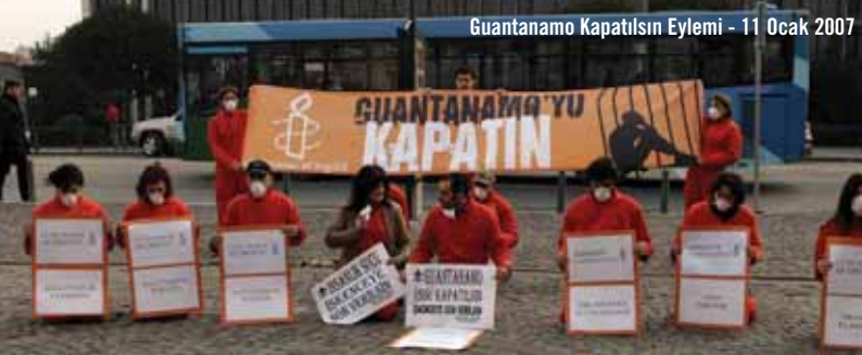
Guantanamo Kapatılsın Eylemi - 11 Ocak 2007