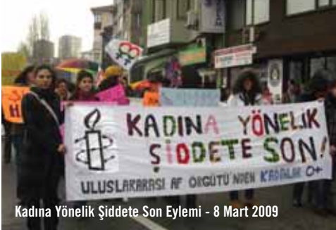
Kadına Yönelik Şiddete Son Eylemi - 8 Mart 2009