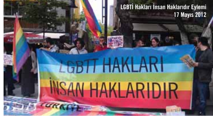
LGBTİ Hakları İnsan Haklarıdır Eylemi 17 Mayıs 2012