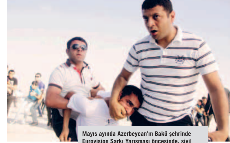
Mayıs ayında Azerbaycan'ın Bakü şehrinde Eurovision Şarkı Yarışması öncesinde, sivil polis hükümet karşıtı bir gösteri sırasında bir muhalefet yanlısını alıkoyarken

Protestocular, Çinli emektar muhalif Li Wangyang'ın ölümünün yasını tutmak için beyaz elbiseler giyerek gözlerini bağlıyor. Wangyang, Haziran ayında, Hunan Eyaleti'nin Shaoyang şehrinde bir hastane koğuşunda gizemli bir şekilde ölü bulunmuştu.