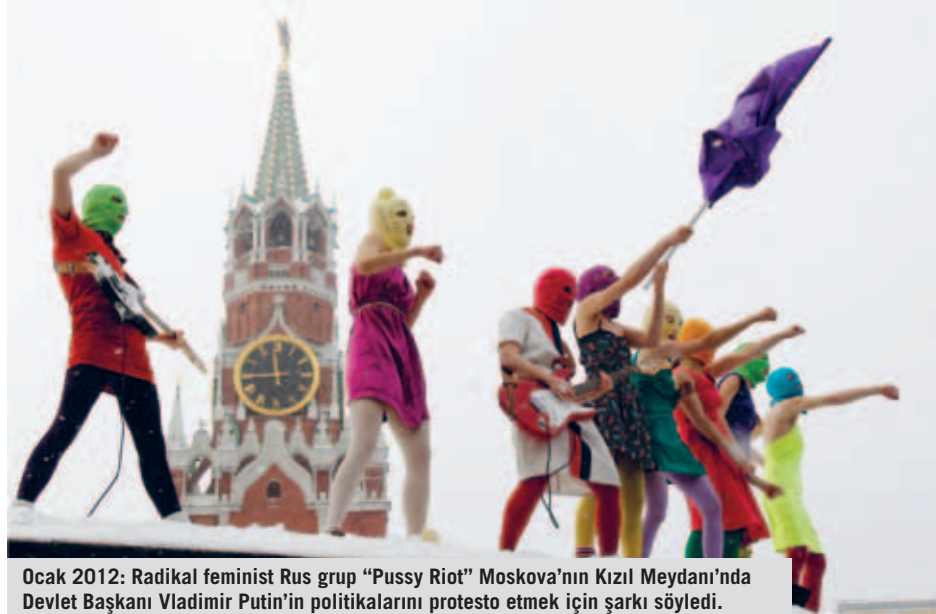
Ocak 2012: Radikal feminist Rus grup "Pussy Riot" Moskova'nın Kızıl Meydan'ında Devlet Başkanı Vladimir Putin'in politikalarını protesto etmek için şarkı söyledi. Ağustos ayında bir başka protesto gösterisinin ardından üç Pussy Riot üyesi cezaevine gönderildi. Biri Ekim ayında serbest bırakıldı; diğer ikisi hala cezaevinde.

Thomas Lubanga'nın Demokratik Kongo Cumhuriyeti'nde (DKC) işlediği savaş suçları nedeniyle 14 yıl hapis cezasına mahkum edilmesi ile tarihin ilk Uluslararası Ceza Mahkemesi (UCM) davası hükmüne şahit olduk. Uluslararası Af Örgütü'nün UCM'nin kurulması için kampanya yürütmeye başlamasından 18 yıl sonra alınan bu tarihi karar, Lubanga'nın silahlı grubunun işlediği iddia edilen suçlarının sadece bir kısmını kapsadı ve Demokratik Kongo Cumhuriyeti'ndeki insanların daha çok şiddet ve güvensizliğe sürüklendiği bir yılda verildi. Verilen hüküm dünyada bir değişim yaratabildiğimizi, ancak her zaman dikkatli ve tetikte olmamız gerektiğini gösteriyor. Her zaman insan hakları ihlallerine yönelik takipte olmalı, ihlallere dikkat çekmeli, ihlalleri protesto etmeli ve adalet talep etmeliyiz. İşin sırrı gücümüzü korumak: 2013 boyunca yeni küresel sorunlar bizleri bekliyor. Bu sorunlarla yüzleşeceğiz!