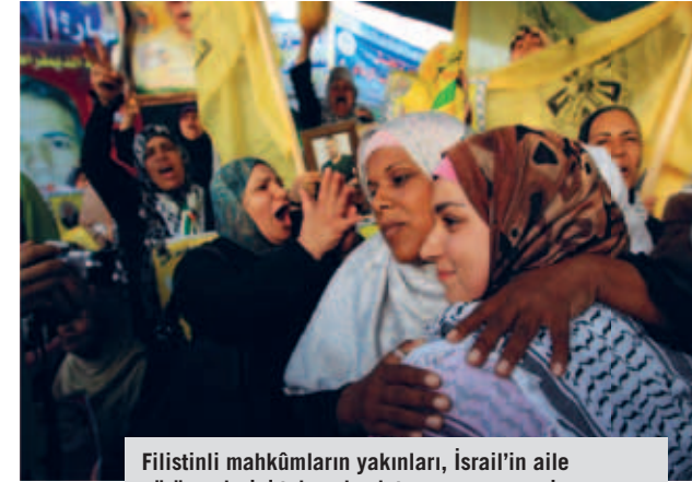
Filistinli mahkûmların yakınları, İsrail'in aile görüşmelerini tekrar başlatmayı ve cezaevi koşullarını iyileştirmeyi kabul etmesi üzerine, Mayıs 2012'de 2,000 mahkûmun bir ay süren açlık grevini sonlandırma kararını kutluyor.