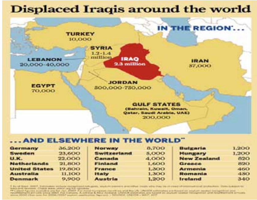
Resim-1: 2007 Sonunda Ortadoğu'da Yerinden Edilmiş Iraklıların Sayısına Dair Bir Tahmin